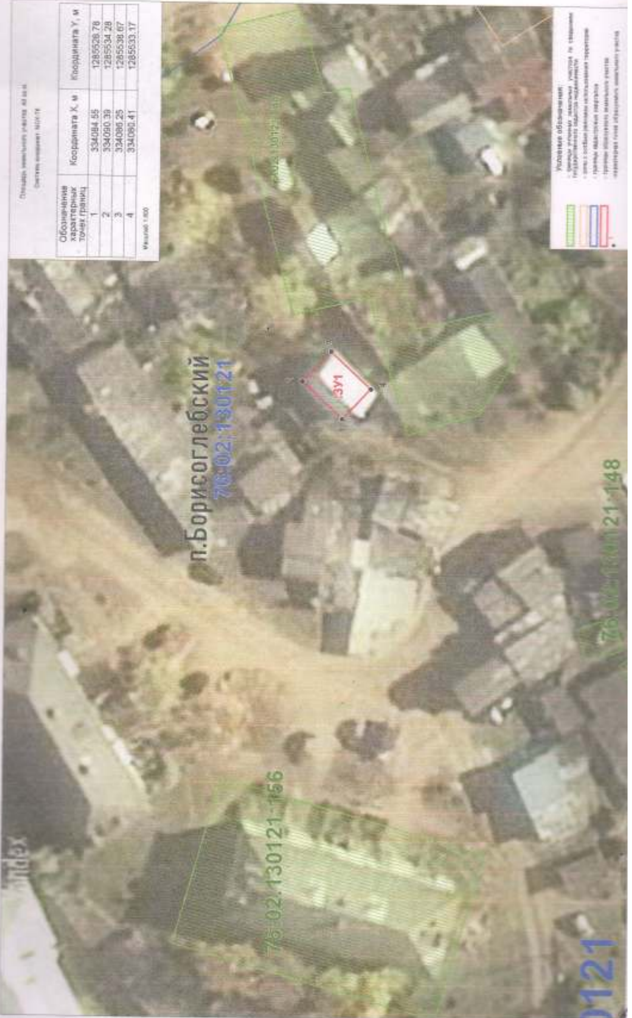
Чертёж межевания территории

Площадь земельного участка, кв. м Система координат: МСК/ПЗС